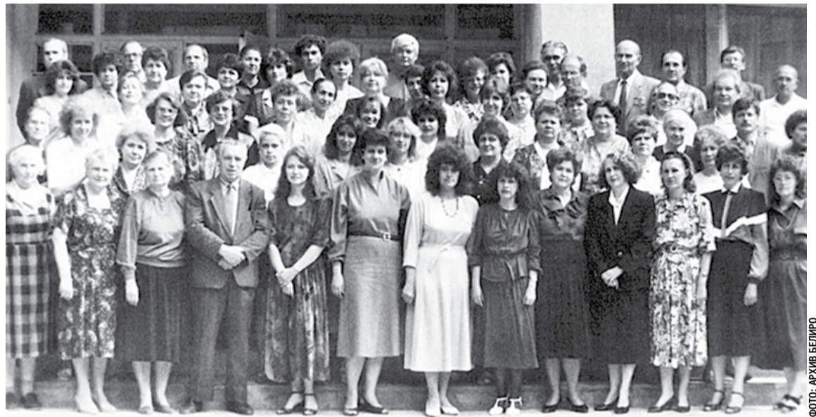
Коллектив Белгородского областного института усовершенствования учителей, 1994 год

Благодаря профессионализму, преданности своему делу, большому трудолюбию, таланту преподавателей, педагогов институт развивался, успешно выполняя свою главную миссию — повышать качество образования Белгородской области. Сегодня наш институт обладает высоким потенциалом, компетентным и работоспособным профессорско-преподавательским составом, который полон творческих планов и замыслов. Надеюсь, что всё это позволит нам эффективно реализовывать как региональные, так и федеральные инициативы. Желаю всем преподавателям и сотрудникам Белгородского института развития образования радости, профессиональных побед, счастья и любви близких, душевного равновесия, интересного и плодотворного учебного года!