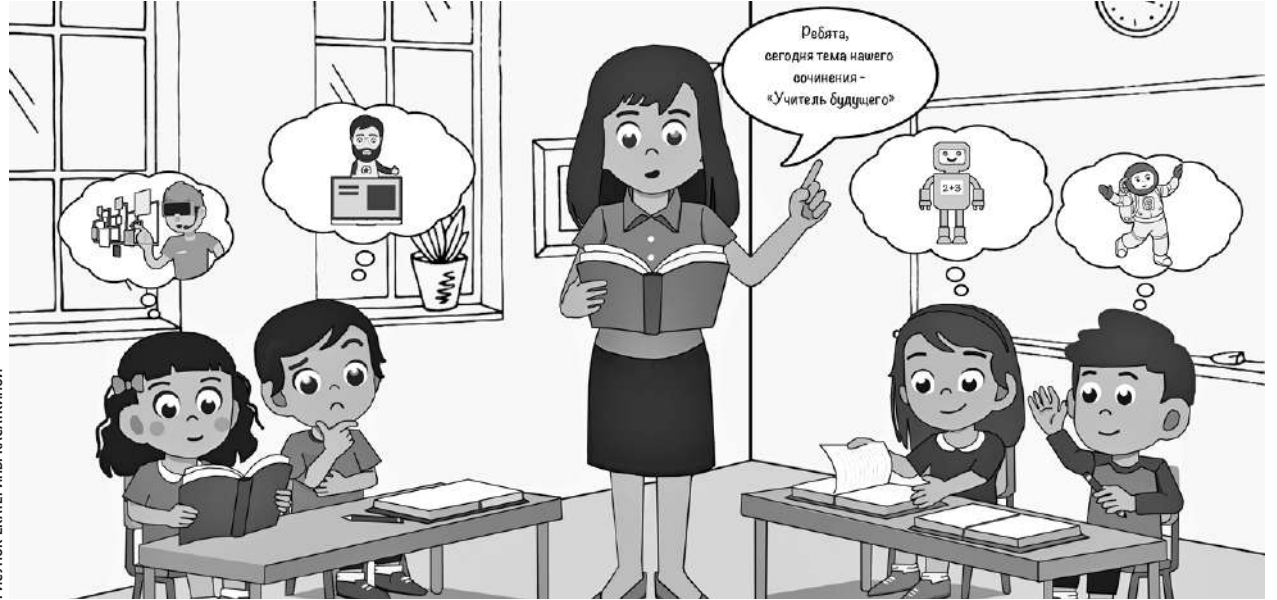
РИСУНОК ЕКАТЕРИНЫ КАСАКИНОЙ

Общая сумма выделенных средств — 10 млн рублей. Из них федеральное финансирование — около 8,5 млн. Почти 1,4 млн —