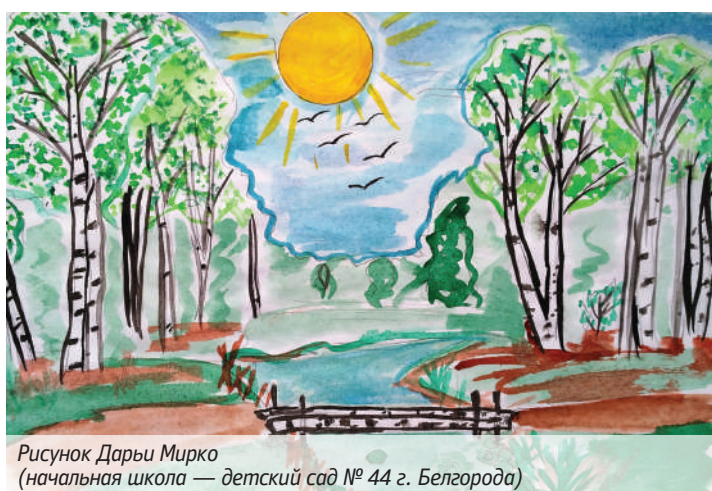
Рисунок Дарьи Мирко (начальная школа — детский сад № 44 г. Белгорода)