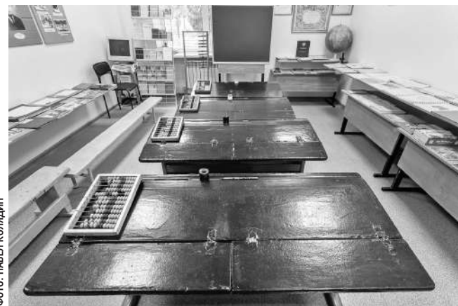
Зал истории образования в музее Томаровской школы № 1

С тех пор все уроки русского языка, литературы и беседы о советском обществе проходили без курьёзов. Молоденькая учительница даже съездила в областное управление кинофикации. Договорилась каждую неделю по пятницам привозить в колонию фильмы.