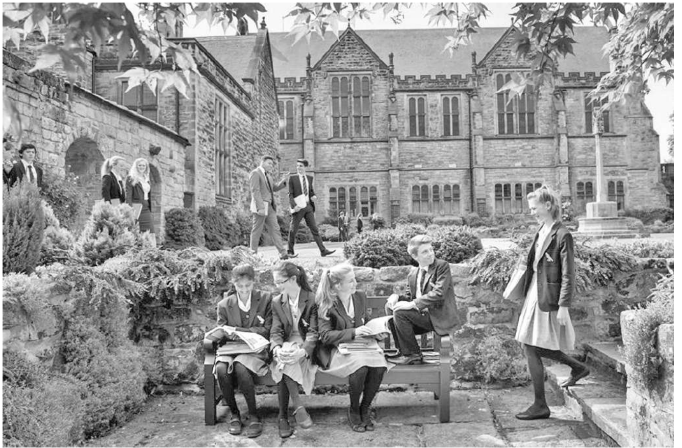
В некоторых канадских школах от формы и не думали отказываться