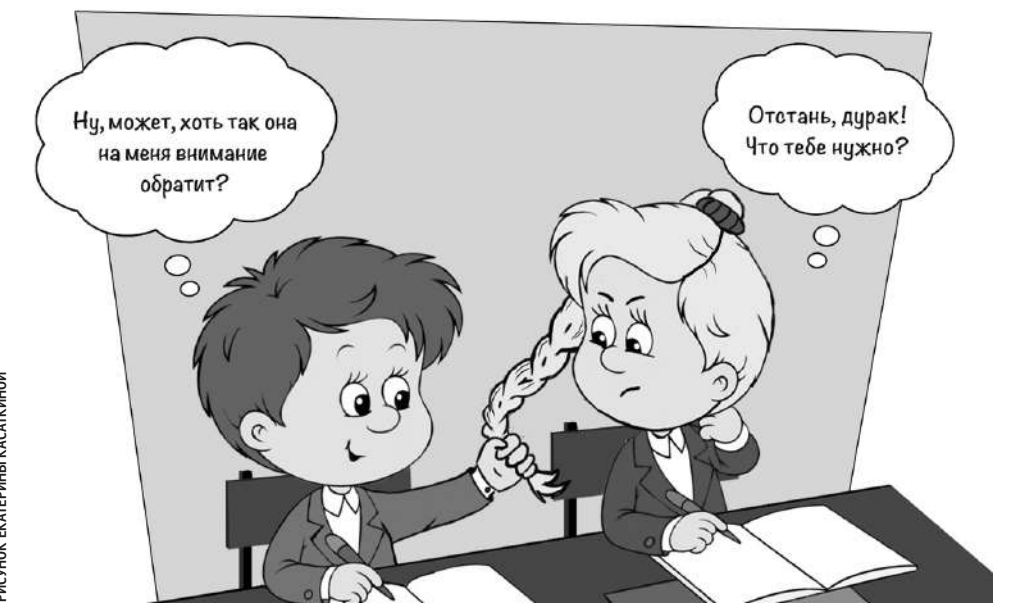
РИСУНОК ЕКАТЕРИНЫ КАСАКИНОЙ

Наши подростки переживают чувства влюблённости, первой любви, дружбы — это прекрасные человеческие чувства и отношения,